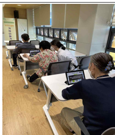
전산화 인지학습 훈련