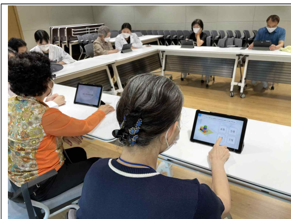
전산화 인지학습 훈련