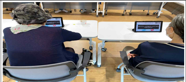
코트라스 인지재활 수업