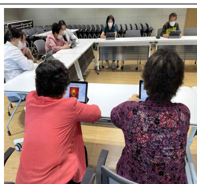
전산화 인지학습 훈련