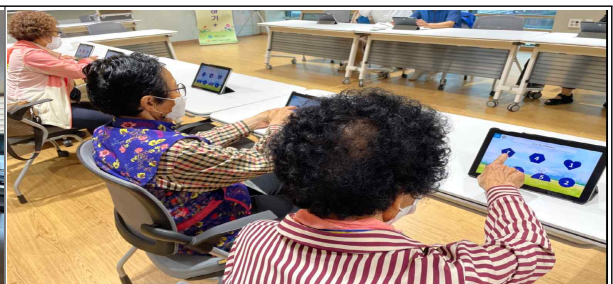
코트라스 인지재활 수업